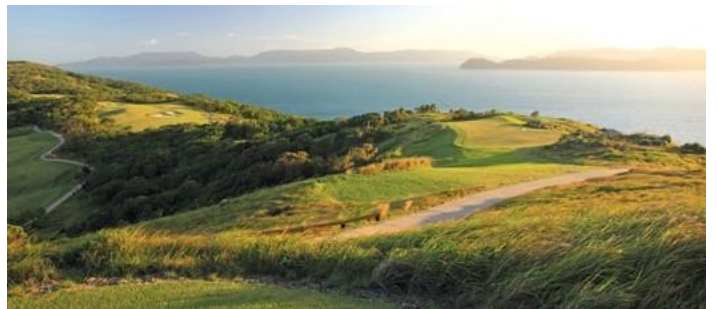
汉密尔顿岛高尔夫俱乐部，登特岛