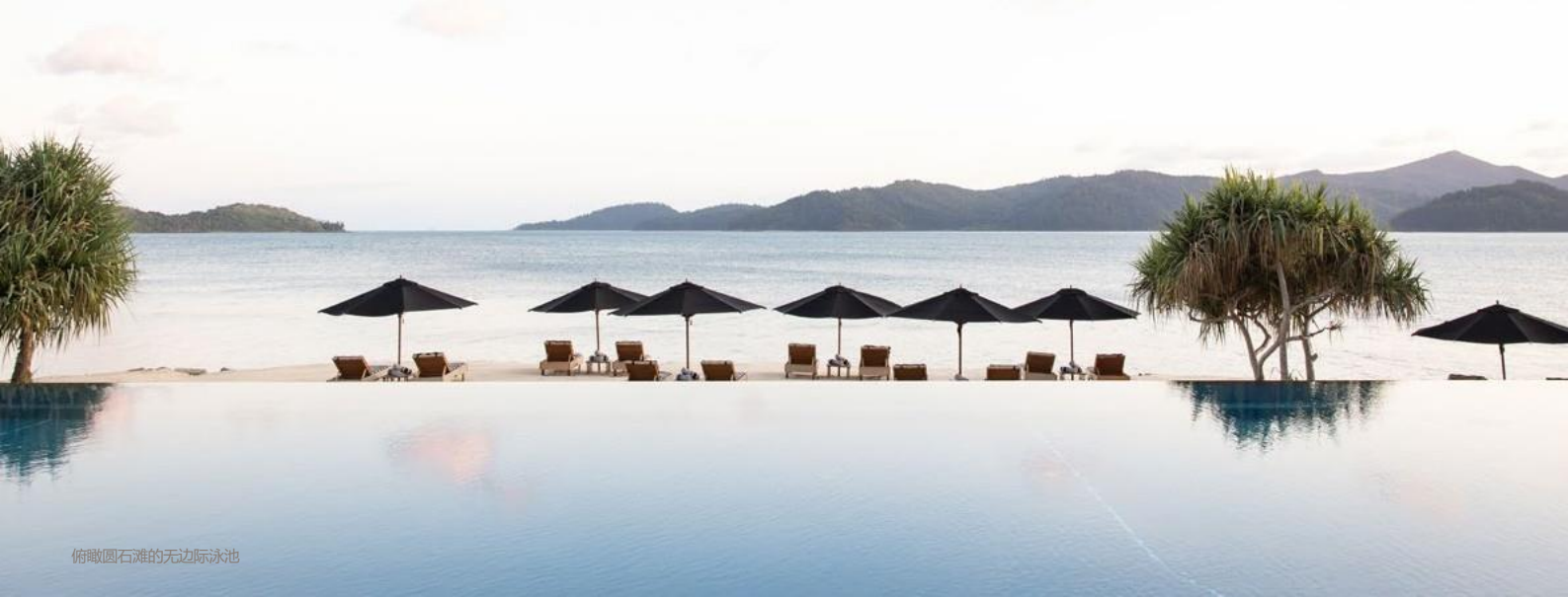
俯瞰圆石滩的无边际泳池