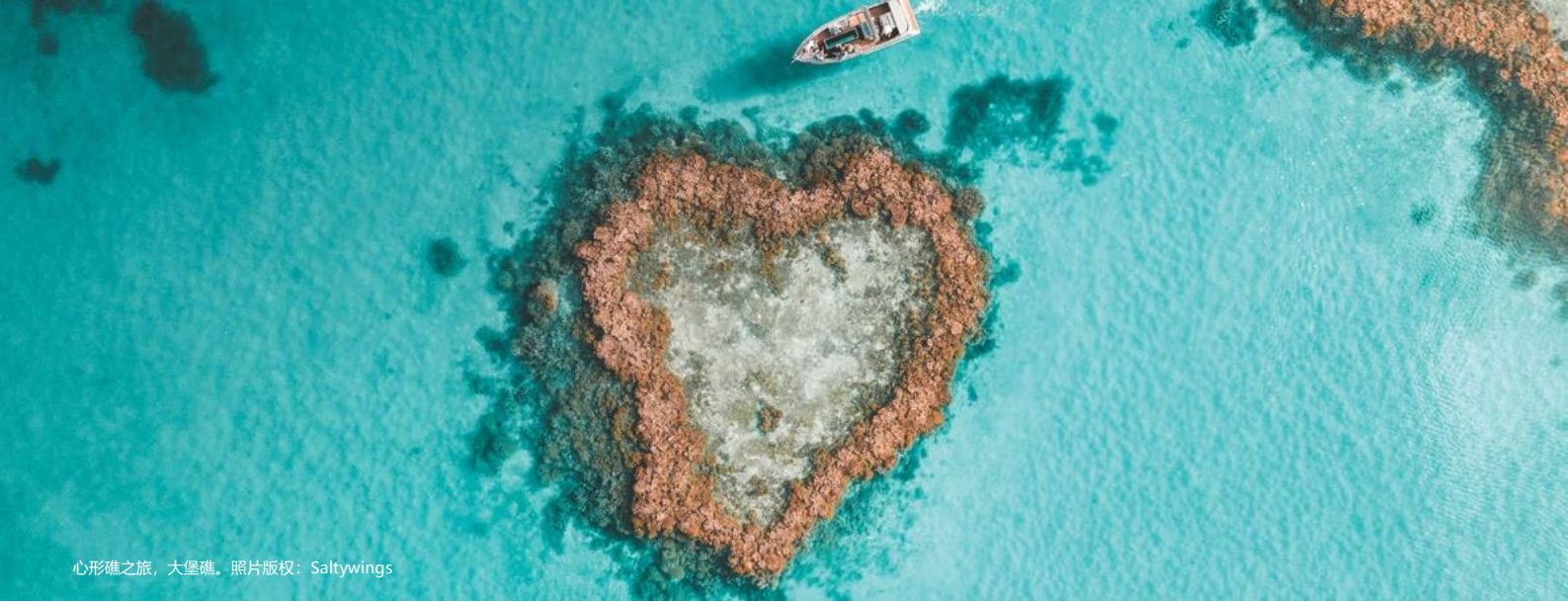
心形礁之旅，大堡礁。