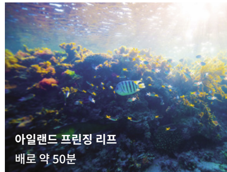
아일랜드 프린징 리프 배로 약 50분