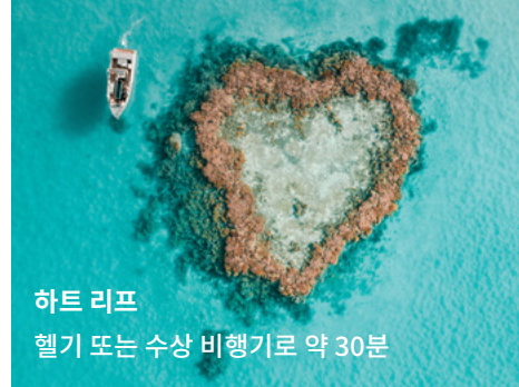
하트 리프 헬기 또는 수상 비행기로 약 30분

해밀턴 아일랜드 대부분의 명소는 걸어서 갈 수 있는 거리에 있습니다. 캣아이 비치/리조트 쪽에서 선착장까지는 여유 있게 10분 정도 걸어가 갈 수 있습니다.