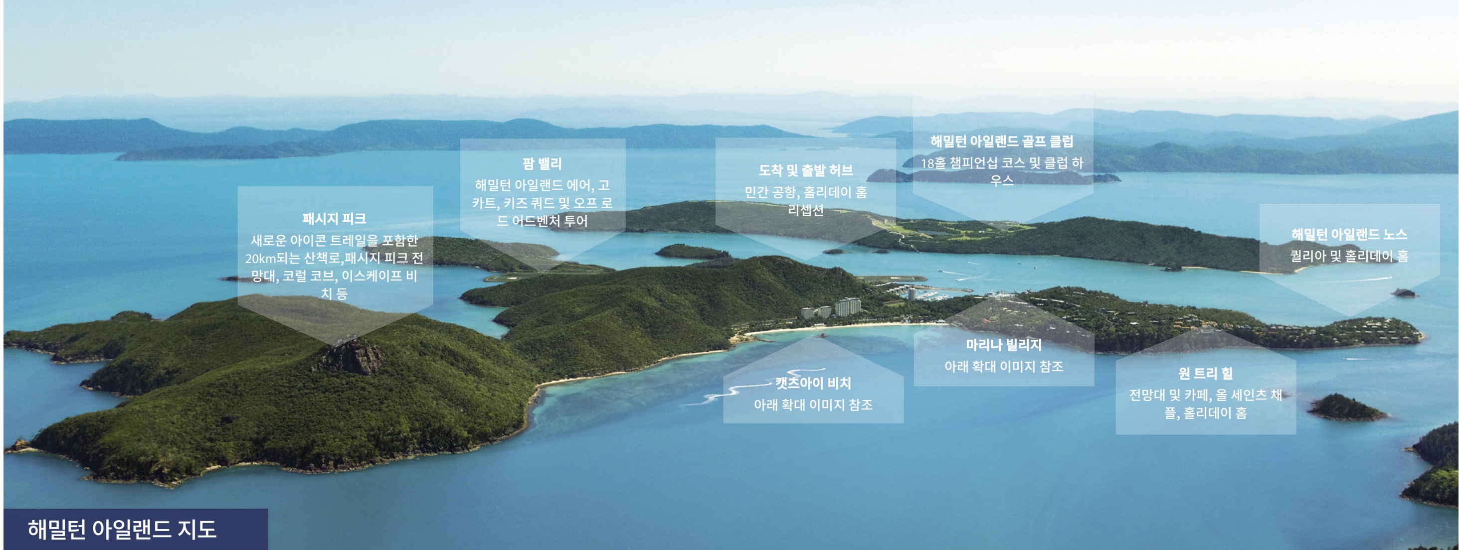
해밀턴 아일랜드 지도